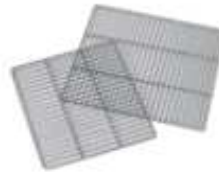
Stainless steel wire shelves