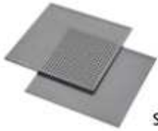
Stainless steel 12mm punched shelves